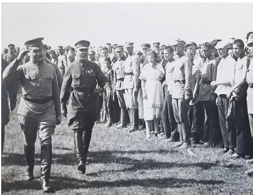
Рис. 3. Ворошилов К.Е и Фрунзе М.В. на Октябрьском поле во время торжественного выпуска красных командиров. 1923 г. [35, л. 3]