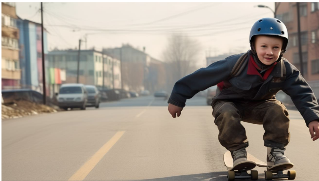
Рисунок 1 — Визуализация стихотворения «С детства скейтбордом Степан увлекался...» с помощью онлайн-генератора изображений «Нейроплод»

Одно из заданий в игре «Правовой лабиринт». Ребята видят на экране изображение, сгенерированное нейросетью. В изображении содержится противоправное действие. Их задача понять, что именно зашифровала нейросеть и какие последствия наступят за это нарушение; например, мальчик на скейтборде едет по дороге из стихотворения «С детства скейтбордом Степан увлекался...» (рисунок 1).