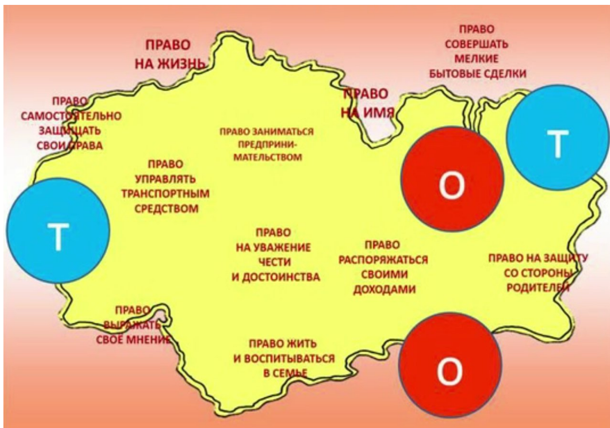
Рисунок 1 — Правовая карта подростка

Конечно, невозможно обсуждать обозначенные проблемы в отрыве от современной ситуации, когда против нашей страны ведётся агрессивная военная и информационная кампания со стороны Запада, прямым следствием которой является активное вовлечение наших подростков и молодых людей в совершение преступлений на территории России. Проводя правовую консультацию, мы ставим задачу донести до её участников о беспрецедентной вербовке врагами Российской Федерации молодых россиян для совершения провокаций и тяжких преступлений против собственной страны и своих сограждан, о стремлении наших противников такими подлыми методами максимально дестабилизировать обстановку в России, ослабить страну, подорвать дух российского народа – сделать всё, чтобы наша страна потерпела поражение в специальной военной операции.